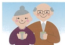
介護予防関連商品

「関西健康産業フェア」「関西美容産業フェア」は特定の販売ルートに かたよることの無い、健康・美容・介護予防関連商品の取扱事業者様な らどなたでも出展、展示即売していただけるオープンなビジネスフェアで す。毎年、多彩なジャンルの健康・美容関連商材が出展され、今回から は介護予防関連商品も加わり、さらに幅広い関連業界の方々、美と健 康、介護予防に関心の高い一般消費者までの来場が期待されます。