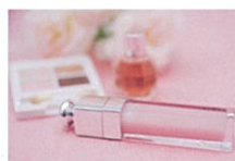
ナチュラルコスメ・ サロン向けコスメ