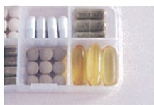
健康食品・サプリメント