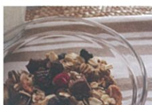
自然食品・こだわり食品