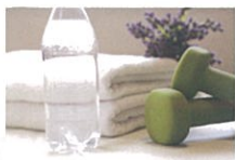
健康機器・美容機器、 ビューティー・ダイエット商品